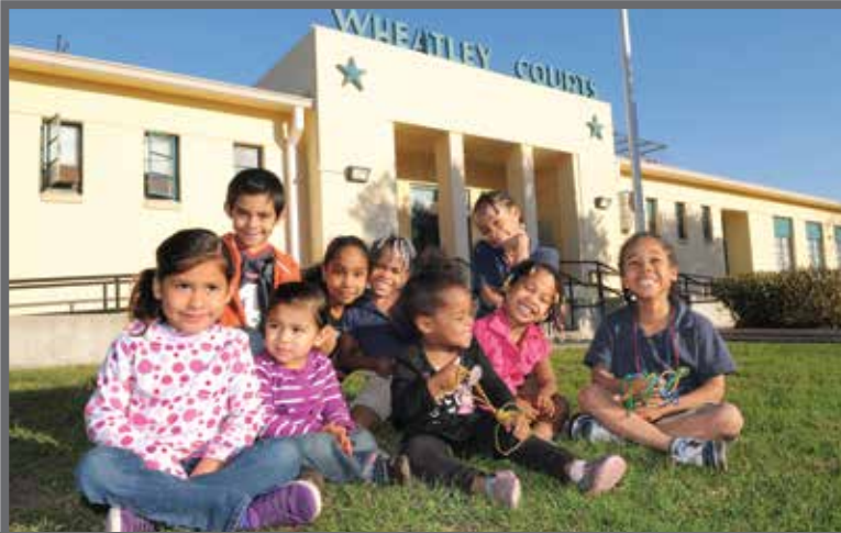
Niños residentes en Wheatley Courts se benefician de los $30 millones de Choice Neighborhood Initiative

El Eastside de San Antonio es el lugar en el que se centra la Neighborhood Revitalization Initiative (Iniciativa de revitalización de vecindarios, NRI) de la Casa Blanca, y es la única comunidad del país que ha recibido las tres subvenciones de los departamentos federales de la NRI: Choice Neighborhood (HUD), Promise Neighborhood y Byrne Memorial Justice Assistance. Todas estas subvenciones son conformes con la planificación ya existente de la comunidad local y con el trabajo de puesta en marcha e inversión. Este esfuerzo de colaboración ha llevado a los residentes a trabajar con las agencias públicas y los negocios de la zona para volver a diseñar el futuro de su comunidad y las oportunidades que les brindará el futuro.