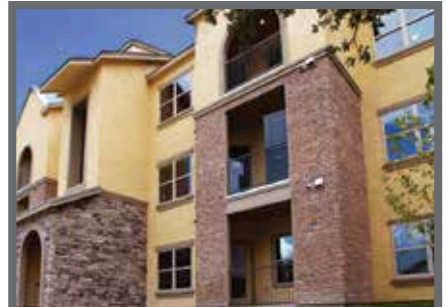
El Park at Sutton Oaks a punto de terminar

El Park at Sutton Oaks tendrá 49 unidades de viviendas públicas, 113 unidades asequibles (créditos fiscales) y 46 unidades a precio de mercado, con un total de 208 unidades con uno a cuatro dormitorios.