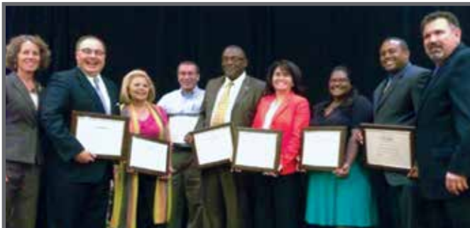
Comisionados de SAHA y empleados reciben reconocimientos nacionales de NAHRO en Denver, CO.

SAHA ha recibido siete Reconocimientos al mérito por sus programas de desarrollo de viviendas y comunidades, otorgados por la Asociación Nacional de Funcionarios de Vivienda y Reurbanización (National Association of Housing and Redevelopment Officials, NAHRO). Los reconocimientos se otorgaron por los siguientes programas e iniciativas de SAHA: