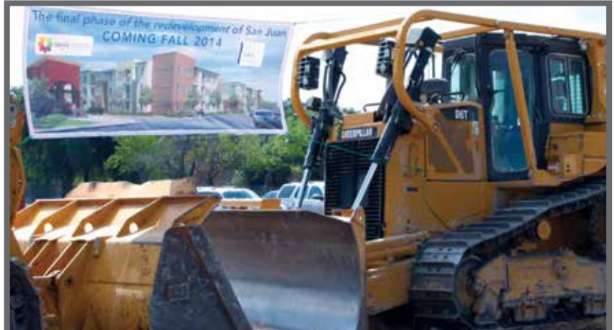
Maquinaria esta lista para iniciar la construcción de San Juan III.

El socio promotor de SAHA en San Juan es NRP Group